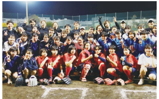
ジュニアアスリート育成事業 ソフトボール中学生女子