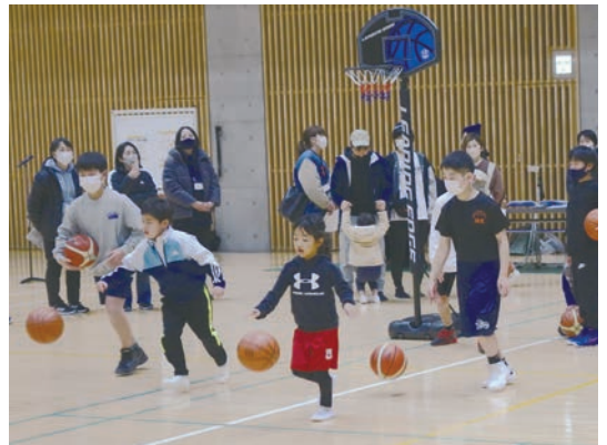
スポーツ少年団体験会 ミニバスケットボール

今後高齢者が健康で長生きできる環境作りや、子どもたちが元気でスポーツに熱中し、全国大会に出場するハイレベルな選手の育成を目指す組織の実現をめざして、犬山市民のスポーツ活動のけん引者であり続けるよう努力していきます。