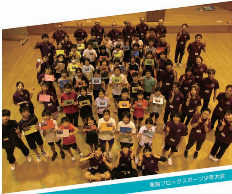
東海ブロックスポーツ少年大会