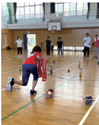
基礎練習。単に転がすだけでは ないのです