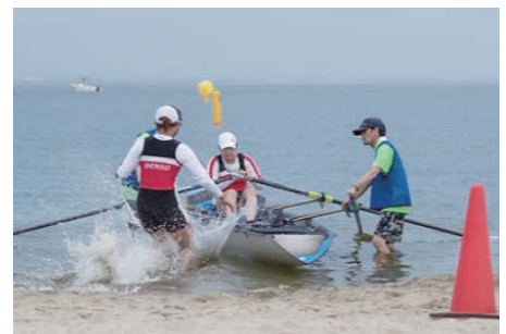
▶蒲郡ビーチスプリント