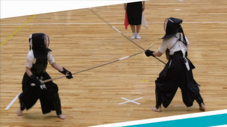
国体東海ブロック大会