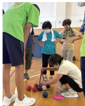
ゲーム。接戦なのでキャ リパーで計測中